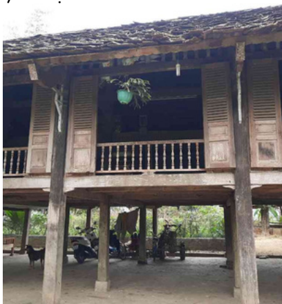
Nhà sàn đặc trưng của người Thái

Ở xã Hạnh Sơn, 70% các hộ dân sử dụng nước máng lắn, khe, mố. Trước kia, người dân có tập quán đốt nương làm rẫy và chặt phá rừng nên không có nước sinh hoạt và trồng trọt. Có thời điểm, khoảng 50 ha ruộng lúa không nước để canh tác và 5 thôn/bản với hơn 600 hộ dân không có nước dùng sinh hoạt hàng ngày, người dân phải đi gánh và lấy nước ở các thôn khác rất vất vả.