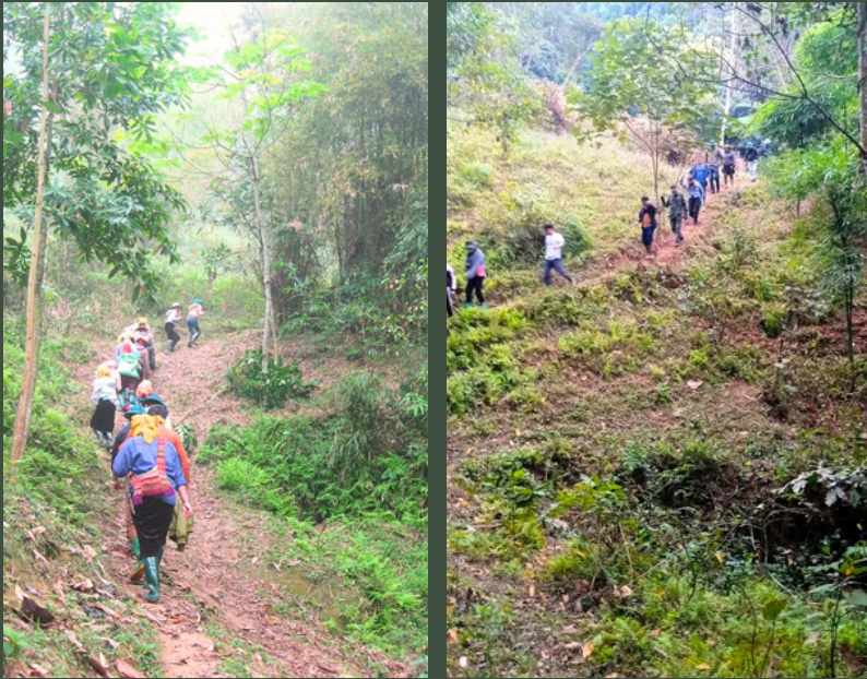
Tổ bảo vệ rừng và nguồn nước đi tuần tra