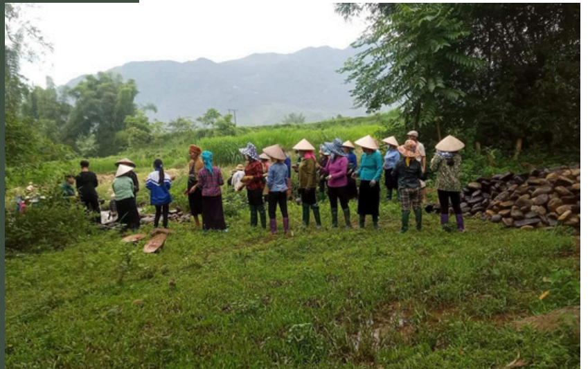
Các hộ dân cùng nhau góp sức làm đường dẫn nước chung mới

Trong tất cả các hoạt động, phụ nữ Hạnh Sơn luôn tham gia rất tích cực, là nguồn lực chính, không quản ngại vất vả, khó khăn, không phân biệt vai trò giới vì lợi ích của chung và của gia đình.