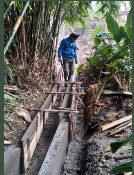
Người dân bỏ sức lao động và đóng góp tiền mua cát sỏi xây kênh mương