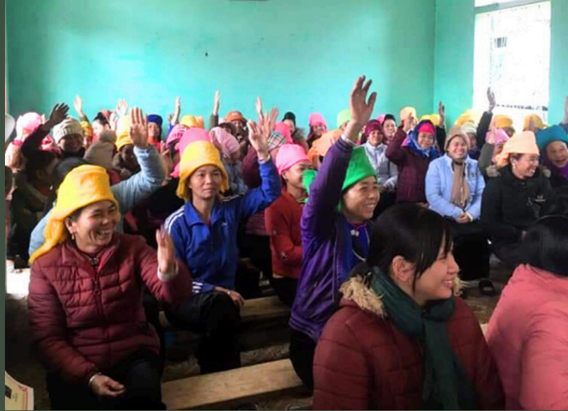
Họp tuyên truyền vận động nhân dân xây kênh mương

Để có nguồn nước phục vụ cho hơn 50 ha canh tác lúa, UBND xã đã có chủ trương xây dựng kênh mương nội đồng bằng bê tông hóa với phương án nhà nước và nhân dân cùng làm. UBND xã hỗ trợ xi măng, nhân dân đóng góp cát, sỏi và công lao động để thực hiện. Các tổ tự quản về bảo vệ rừng và nguồn nước sẽ phối hợp cùng với cán bộ xã xuống từng thôn, bản để tuyên truyền vận động nhân dân đóng góp tiền mua cát sỏi và công lao động để xây dựng kênh mương dẫn nước về phục vụ cho việc sản xuất lúa và hoa màu. Công tác vận động mới đầu cũng rất khó khăn, tuy nhiên sau khi người dân được nghe và giải thích về lợi ích khi xây dựng kênh mương thì đã ủng hộ. Hiện nay trong toàn xã chúng tôi, trên 60% các cánh đồng đã có kênh mương nội đồng được bê tông hóa.